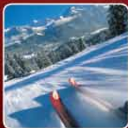
ÉVÉNEMENTIEL, SPORTS & LOISIRS