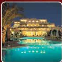
HÔTELLERIE & TOURISME

Spécialisations possibles dans la gestion en: